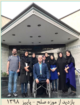
بازدید از موزه صلح - پاییز ۱۳۹۸