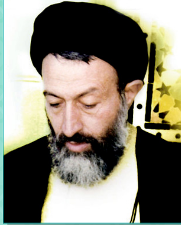
شهید دکتر بهشتی

دانشجویان باید همچنان به عنوان حاملان پیام انقلاب و تضمین کنندگان پویایی و تحرک انقلابی بمانند. رسالت دانشجو این است که همچنان پیشگام انقلاب باشد و پیشاهنگ حرکت باشد. دانشجو باید فرهنگ این انقلاب را روز به روز بهتر بشناسد و بهتر پاسداری کند.