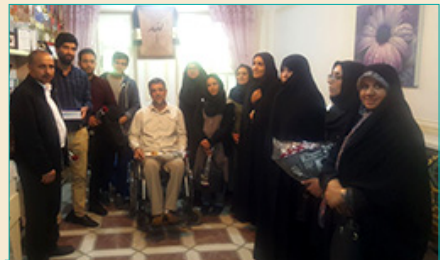
دیدار با جانبازان مرکز توانبخشی حضرت امام خمینی (ع) - بهار ۱۳۹۸