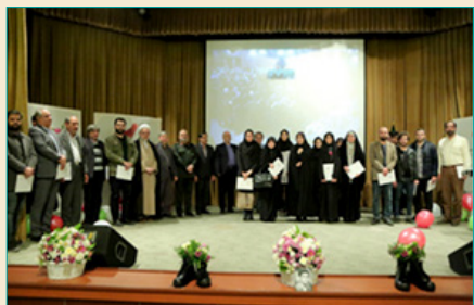
گرامیداشت چهل و یکمین سالگرد پیروزی انقلاب اسلامی، یادواره شهیدای دانشگاه شهید بهشتی و علوم پزشکی و هشتمین گردهمایی جامعه شاهد و ایثارگر - زمستان ۱۳۹۸