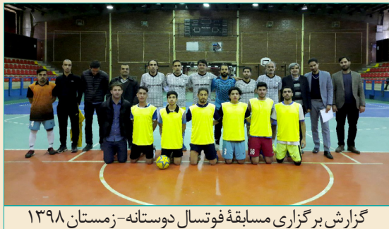
گزارش برگزاری مسابقه فوتسال دوستانه- زمستان ۱۳۹۸