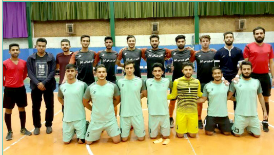
قهرمانی تیم فوتسال کانون فرهنگی ورزشی ایثار- بهار ۱۳۹۸