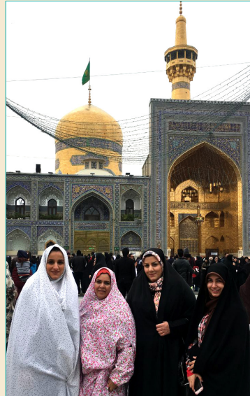
اردوی مشهد مقدس - پاییز ۱۳۹۸